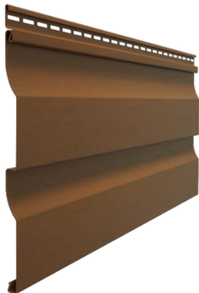
Сайдинг D4,5D (корабельный брус, 4,5")